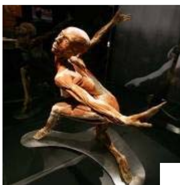
Angeblich bewerben sich viele Menschen für einen Platz in der "Körperwelten"-Ausstellung des Anatomen Gunther von Hagen.

Knoblauch: Wenn diese Schülerinnen tatsächlich vorgelassen würden zum Seziertisch, dann wären sie wohl schockiert, wie Leichen in der Forensik aussehen können.